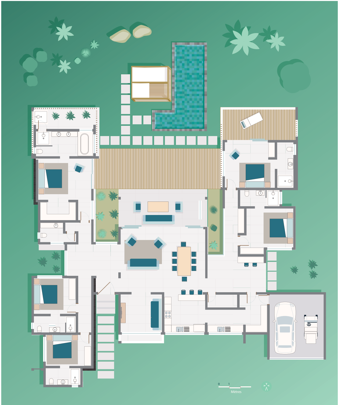
Rez-de-chaussée / Ground floor level.